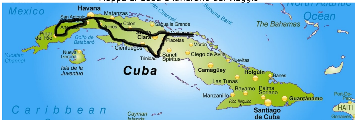
Mappa di Cuba e itinerario del viaggio

Il programma del viaggio è impostato per consentire ai partecipanti di conoscere l'attualità cubana, la loro storia, la cultura, le tradizioni, ed il folclore di questo popolo caraibico, ingiustamente discriminato da un blocco economico U.S.A., che ha segnato la nostra Storia contemporanea e favorito i germogli di un graduale cambiamento in atto in tutto il Continente Latino Americano e nel Mondo globalizzato, capitale della Pace, incontro di culture e religioni.