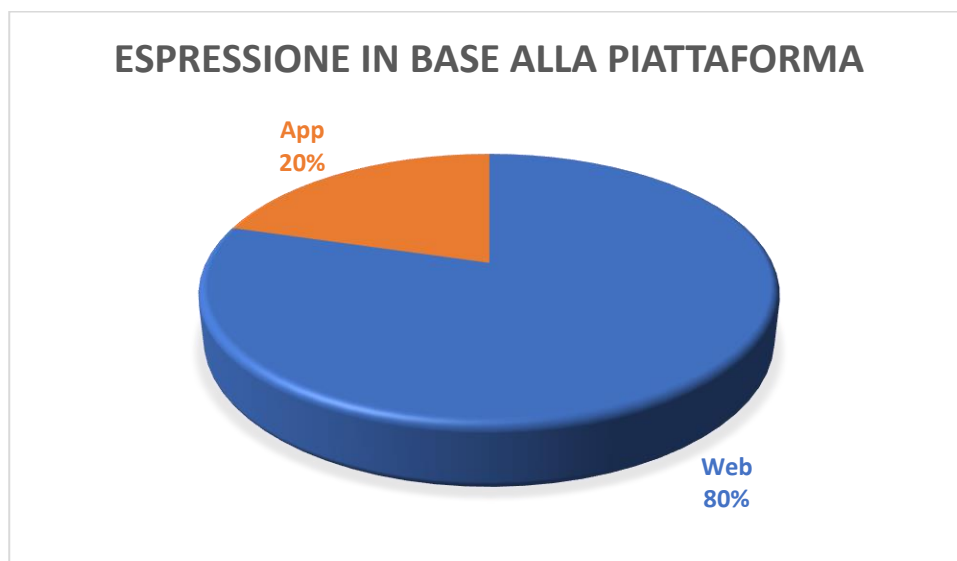
GRAFICO IN BASE ALLA PIATTAFORMA

Se guardiamo lo strumento, si conferma che DigitalAIDO è utilizzato maggiormente tramite il sito (80%).