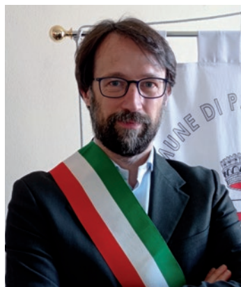
Gianpaolo Torchio Sindaco di Paderno D'Adda