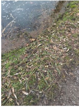
Vegetazione di ripa tagliata