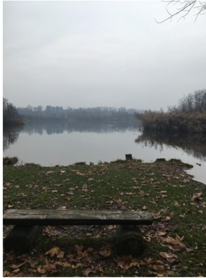
Assenza di vegetazione di ripa, tronchi di alberi tagliati qualche anno fa a favore del belvedere vista lago dalla panchina o dalle case